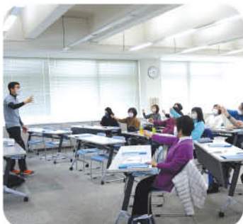
介護予防ボランティアフォローアップ講座 (関連記事5p掲載)