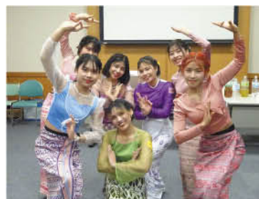
ミャンマーの踊りを披露