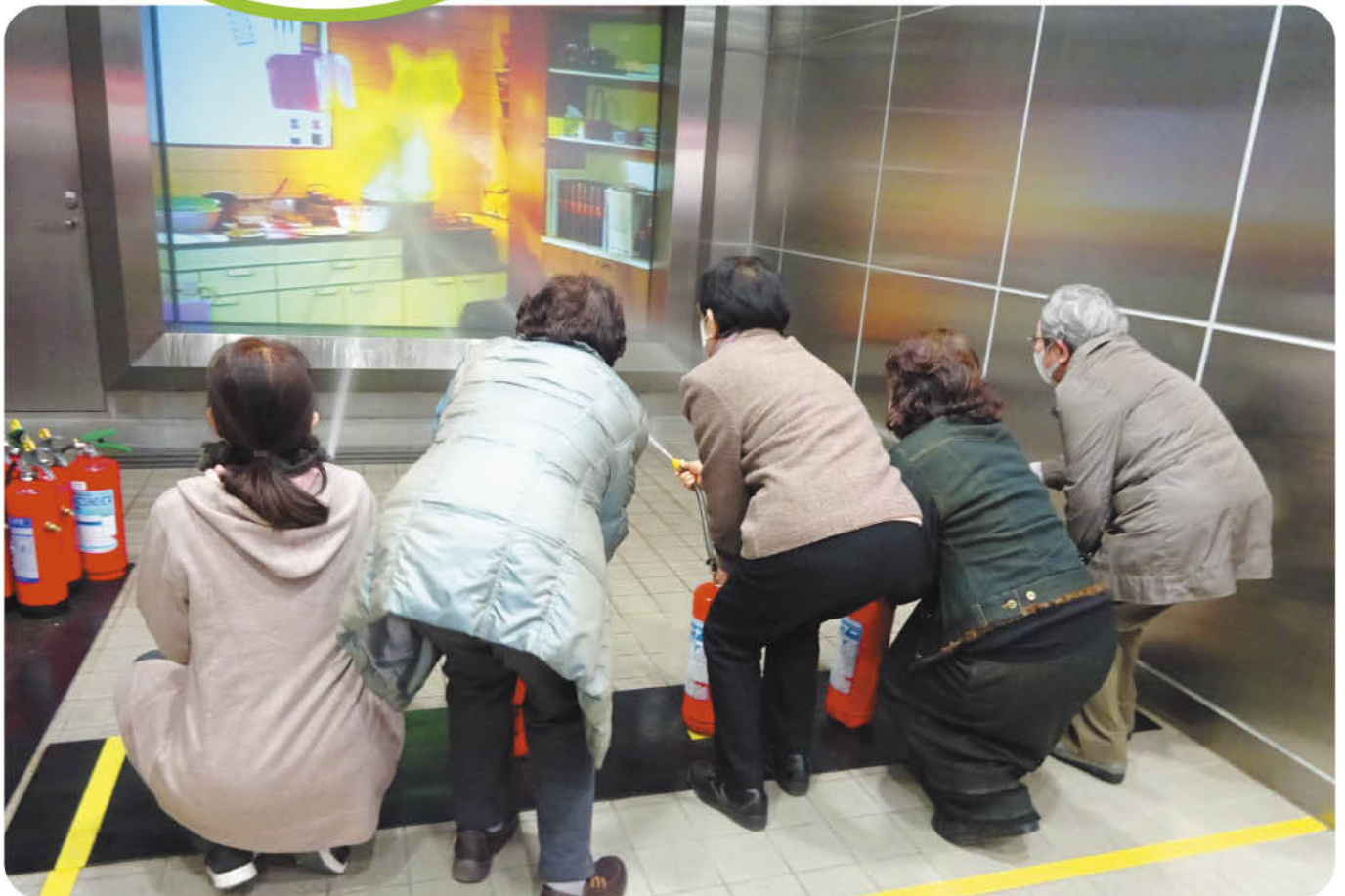
高瀬町ボランティア協議会研修にて消火体験を行いました。詳しくは6ページをご覧ください。(撮影場所:香川県防災センター)