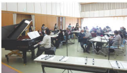
▲みんなで歌って楽しみました