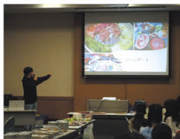
ラオスの食文化について紹介

各国の紹介をした後は、ミャンマーの手作りおやつ（タマネ、チャプチヨ）やイスラム教の戒律に従ったハラール食のお菓子を試食しながら交流の時間をもちました。日本文化も体験してもらおうと実施した餅つきは、「初めての体験！」と盛り上がりました。けん玉やメンコ、コマ回し、羽子板など昔遊びを通し、多世代交流にもなりました。（主催／三野地区まるみプラン実行委員会）