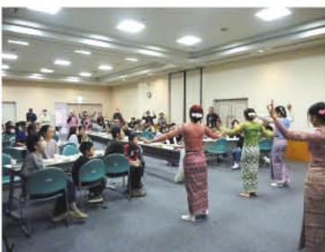
自然と身体が動きます!