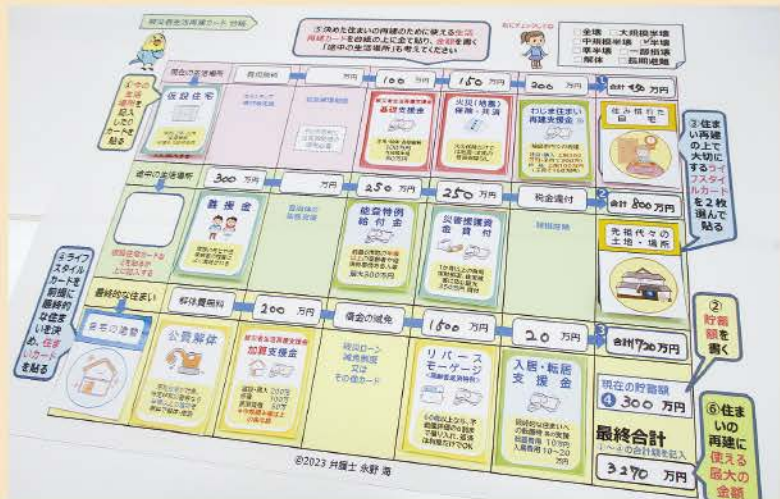
被災者生活再建カード