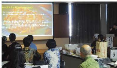
▲高専留学生による出身国についての紹介