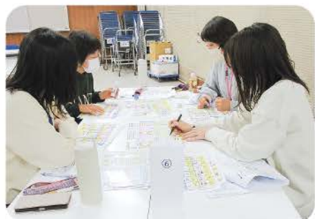
災害ボランティアセンター運営者研修会 (関連記事3p掲載)