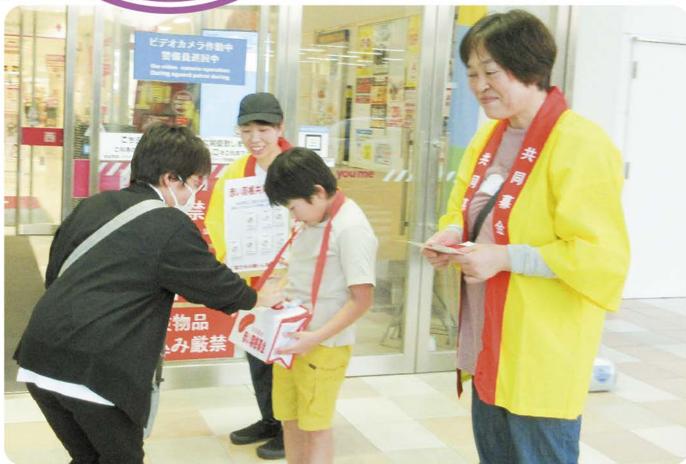
街頭募金の様子(12p掲載)