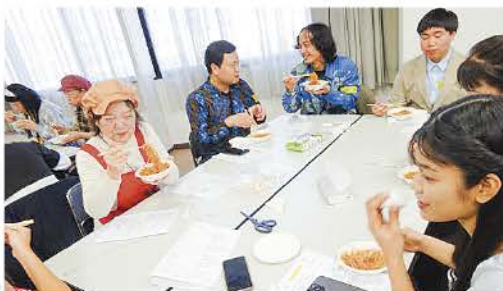
▲「防災食作り」に初チャレンジ!