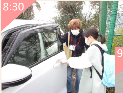
おねがい会員宅へ迎え