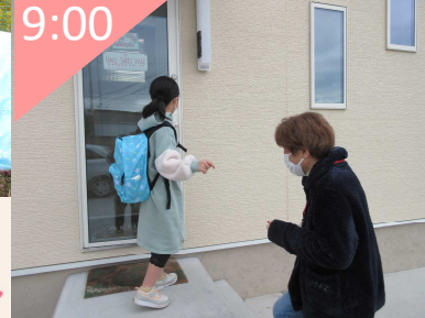
習い事場所へ送り